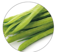
グァーガム (グァー豆由来) 【保湿成分】