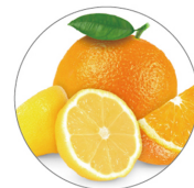
ペクチン (オレンジ・レモン由来) 【保湿成分】

潤いを与える「ボタニカル成分(ペクチン・グァーガム)」を配合し、みずみずしく乾きにくいベースを実現。毛髪への密着性を高めました。