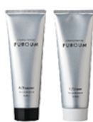
F/ブースター・F/シアール NET.80g/240g 医薬部外品