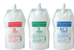
クリエイティブ フェリエ ネオ カラーオキシド 6%・3%・AC3% NET.1000g 医薬部外品